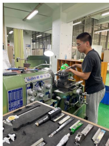
圖 4 110 學年度全國工 科技藝競賽車床職類選 手訓練情形

臺北市整體教育力屢創佳績，校長領導、教師團隊教學表現深獲肯定！領先全國的優質教育環境，已為發展北市技職教育特色奠定厚實基礎。2021 及 2022 年連續經英國經濟學人雜誌教育評比北市蟬聯滿分躍升亞洲四小龍之首，並獲天下雜誌、遠見雜誌、經濟日報教育面向評選全國第一，亦獲得「2021 全球 ICT 傑出數位教育學習獎」首獎、「第 16 屆臺北紐澳商會昆士蘭臺灣商業傑出貢獻獎」及 2021 縣市幸福大調查教育成就指標第一名殊榮，展現領先全國的前瞻教育特色。