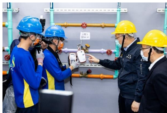
圖 2 110 年 1 月 25 日節能技術教 學中心演示水量平衡調整實習

此外，臺北市專業技能選手在各項技藝（能）競賽中表現亮眼，已連續 4 年（107-110 年）全國高級中等學校工業類學生技藝