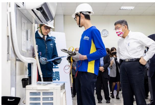
圖 1 109 年 11 月 27 日市長參訪 日立公司空調技術實務課程

臺北市並媒合技術型高中、專家學者及業師合作發展跨域前瞻專業課程，總共已推出領先全國的 71 門產學合作微課程，提供臺北市的學子們累計達 1,781 個名額可依興趣及專長自由選修的課程，培育學生發展創新思考、跨域整合之應用能力。