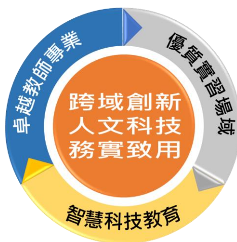
圖 6、臺北市技職教育發展願景

學習之能力，俾以適應不同產業與行業之興衰及更迭，並能適應智慧化及全球化之高素質就業力。這亦是十二年國教技術型高中課綱所強調之專業素養。此外，除了專業素養外，人文素養也是技職教育人才不可或缺的，惟有兼具專業及人文素養之技職人才，才能符合未來產業之所需。因此，本市技職教育以「培育兼具跨域創新、人文科技、務實致用之技術人才」為願景，藉由生涯輔導與職業試探，讓學生能適才適所，選擇適合自己之科系就讀，透過學校與產業間之合作，打造與業界同步之實習場域，精進教師之專業能力，共同培育現代及未來產業所需之實務人才。