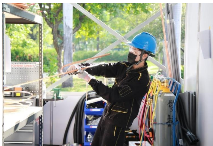
圖 3 第 51 屆全國技能競賽 冷凍空調職類選手訓練情形

競賽獲獎數全國第一，並連續 3 屆（43-45 屆）國際技能競賽獲獎數全國第一，且為全國唯一連續 3 屆贏得國際技能競賽世界金牌城市，為臺北市贏得國際肯定與榮耀。109、110 及 111 年更連續 3 年獲教育部評定「技職教育獎」全國優等首獎等殊榮，豐碩成果領先全國。